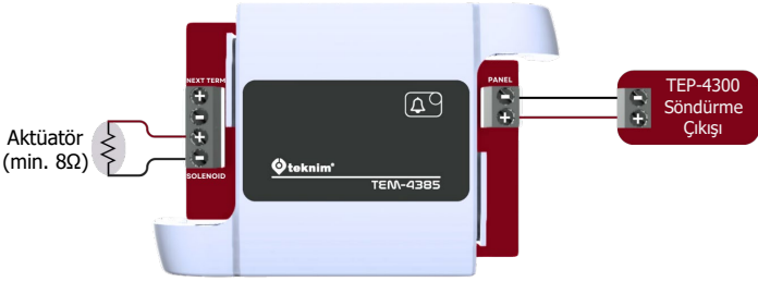
Şekil 1 - Aktüatör için bağlantı