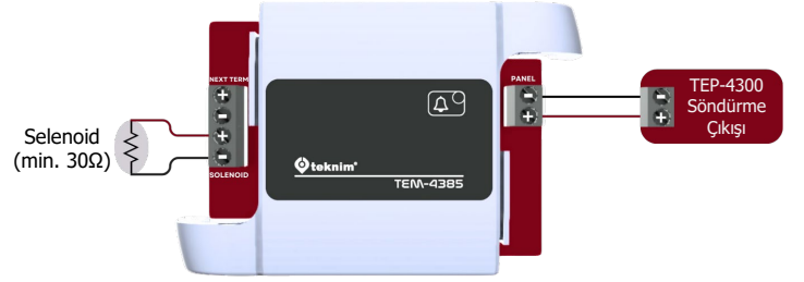
Şekil 2 - Tek selenoid için bağlantı